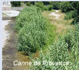
Canne de Provence